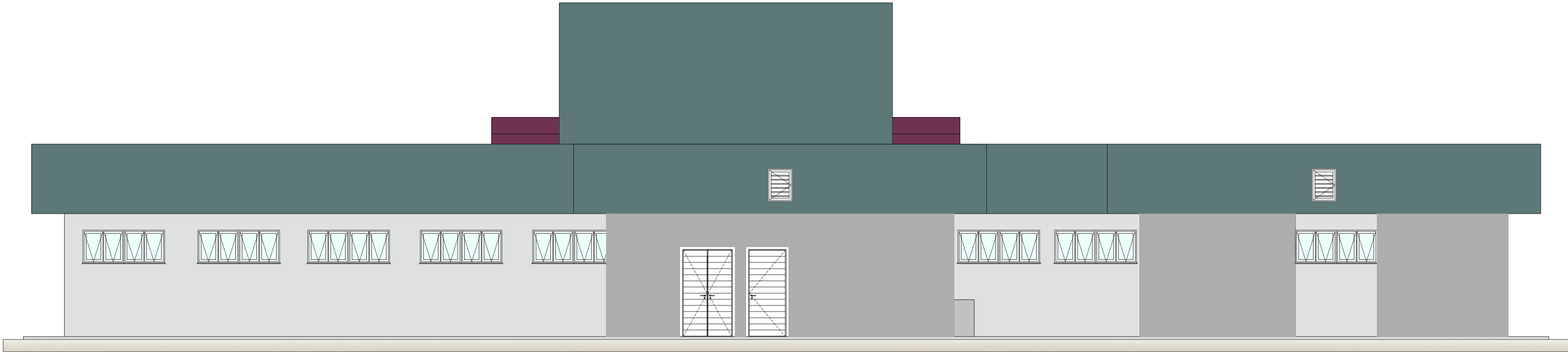
VISTA C ESC. 1:75